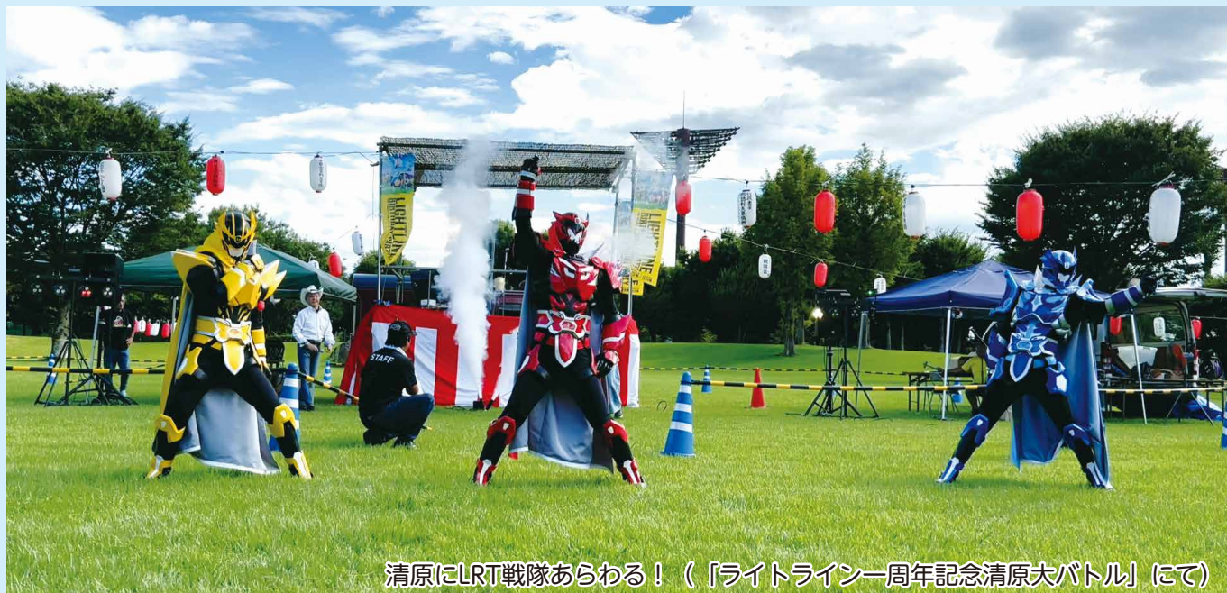
清原にLRT戦隊あらわる！（「ライトライン一周年記念清原大バトル」にて）