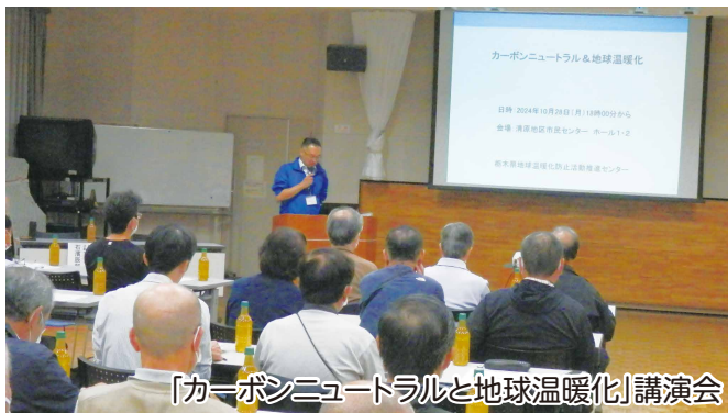
「カーボンニュートラルと地球温暖化」講演会