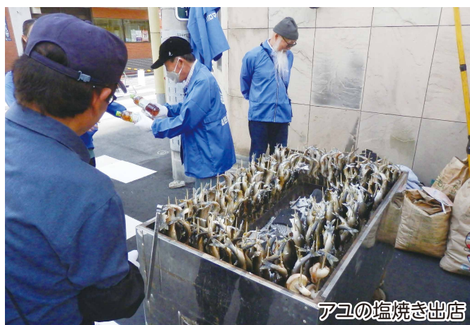
アユの塩焼き出店