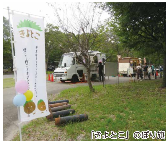
「きよとこ」のぼり旗

今後とも地域活性化、発展に結びつく活動に取り組んでいきたいと思っておりますので、地域住民の皆様のご支援ご協力をお願いします。