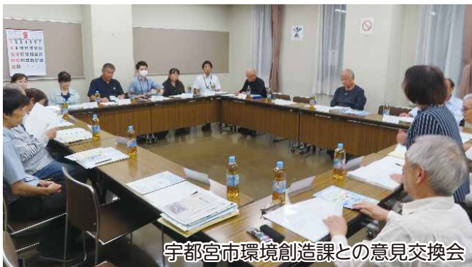
宇都宮市環境創造課との意見交換会

SDGsに基づくこの取り組みを地域に広めるのは難しいとは思いますが、委員が一丸となって取り組んでいきたいと思えます。