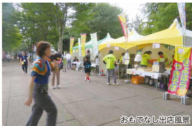
おもてなし出店風景