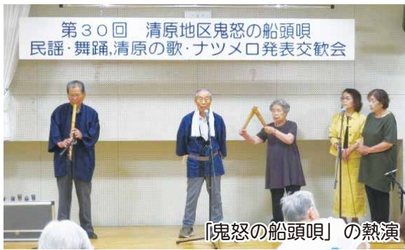
「鬼怒の船頭唄」の熱演

また、例年のように、最後まで観覧応援していただいた皆様に、抽選で地場産のトウモロコシ、トマト、卵など配布し、来年を約束して終了しました。