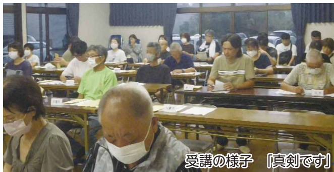
受講の様子 「真剣です」