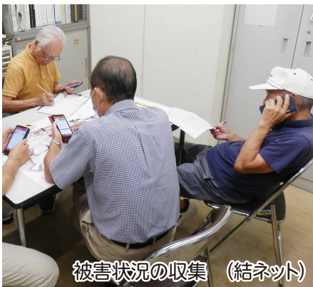
被害状況の収集(結ネット)

第2部では、HUG(避難所運営ゲーム)を活用し「大規模地震(マグニチュード8.0、電気・ガス・水道が遮断)が発生した」との想定で、避難者それぞれが抱える事情を記した避難者カードをグループリーダーが読み上げ、参加者が①避難者の適切な誘導②避難所で起こる様々な出来事への対応などについて話し合い、避難所の運営について学ぶことができました。